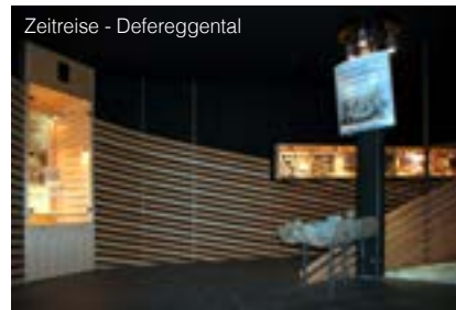
Zeitreise - Defereggental