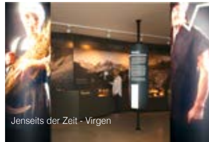
Jenseits der Zeit - Virgen