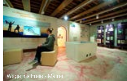
Wege ins Freie - Matrei

Öffnungszeiten: Montag bis Freitag, 8:00 Uhr bis 18:00 Uhr, auf Anfrage Ort: Handlhaus, St. Jakob i. Def.